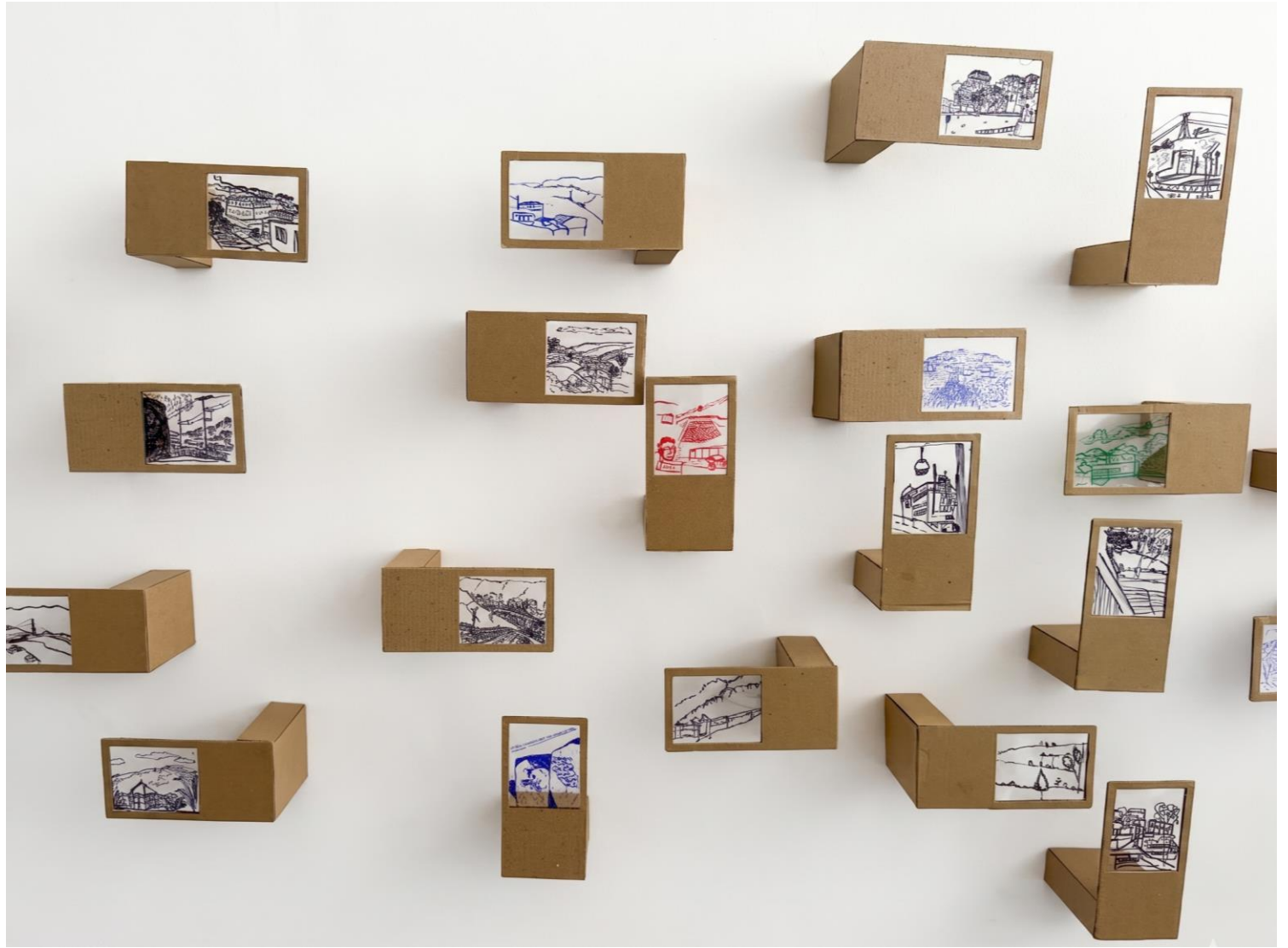
Evidencias Representación y reflexiones de Ciudad: Comuna 1