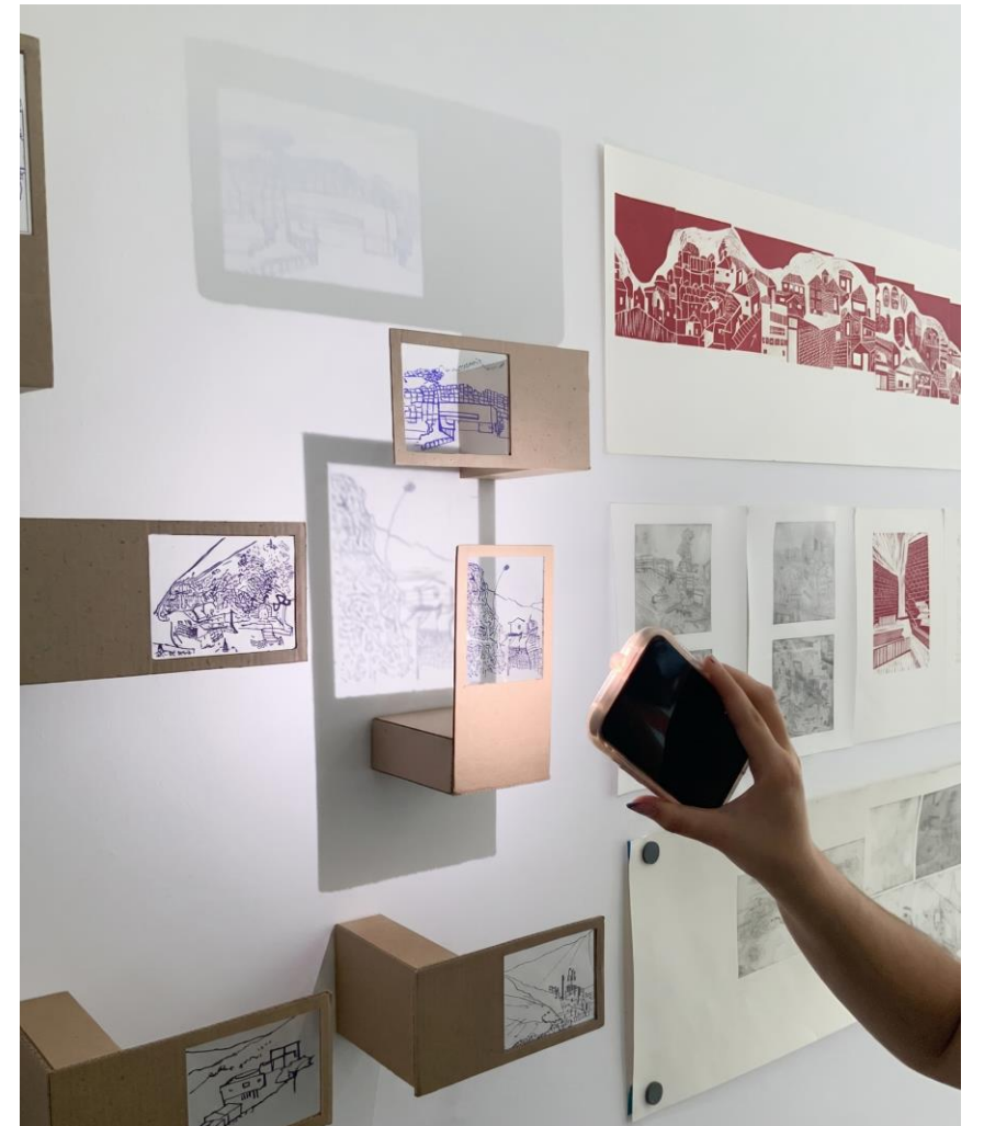
Evidencias Representación y reflexiones de Ciudad: Comuna 1