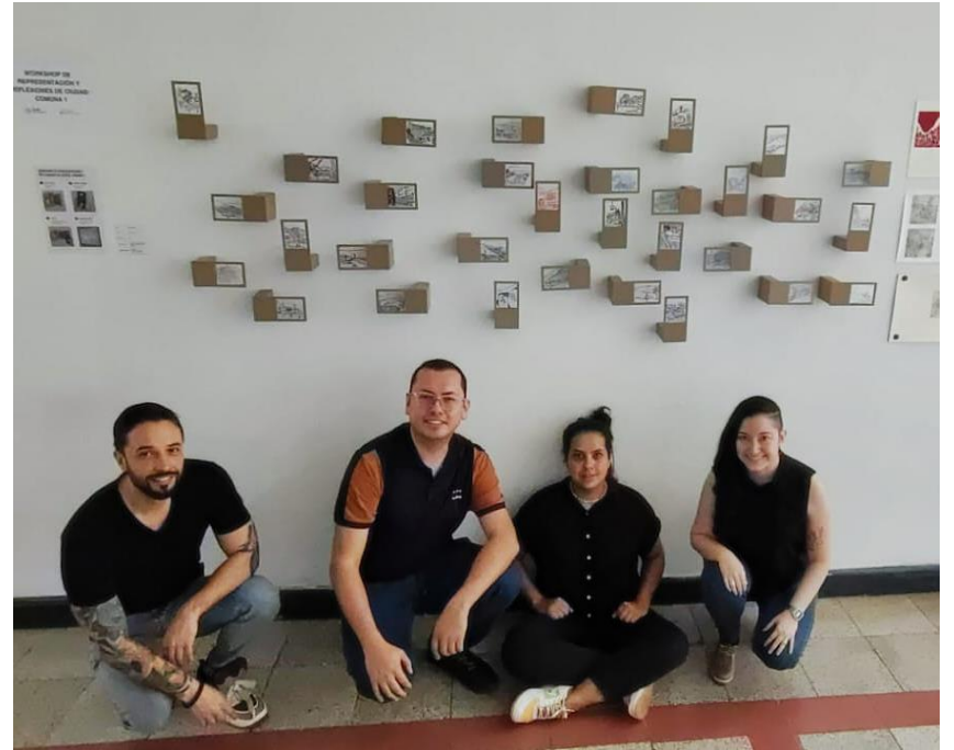
Evidencias Representación y reflexiones de Ciudad: Comuna 1