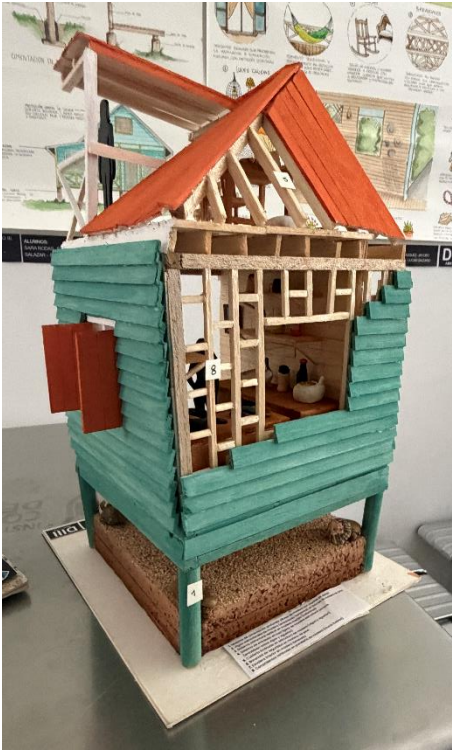
Figura 23 Y 24. Fotografía estudio de caso región Isleña, Grupo B.