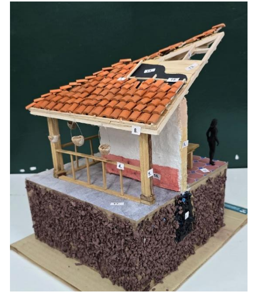
Figura 15 y 16. Fotografía estudio de caso región Isleña, Grupo A.