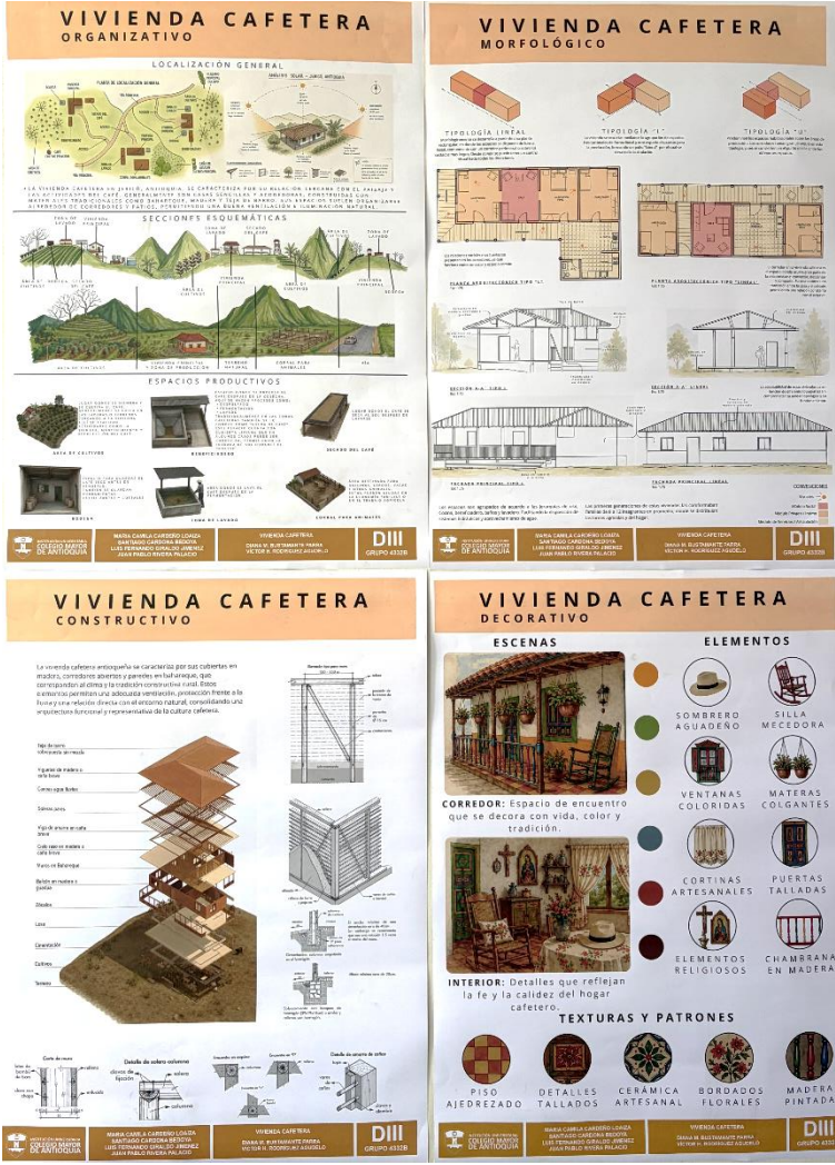
Figura 17. Fotografía estudio de caso región Cafetera, Grupo B.