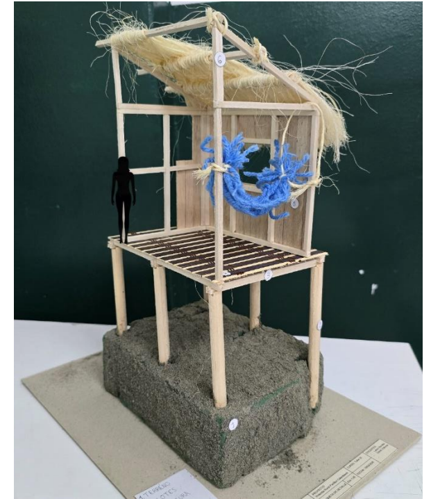
Figura 3 y 4. Fotografías estudio de caso región Pacífica, Grupo A.