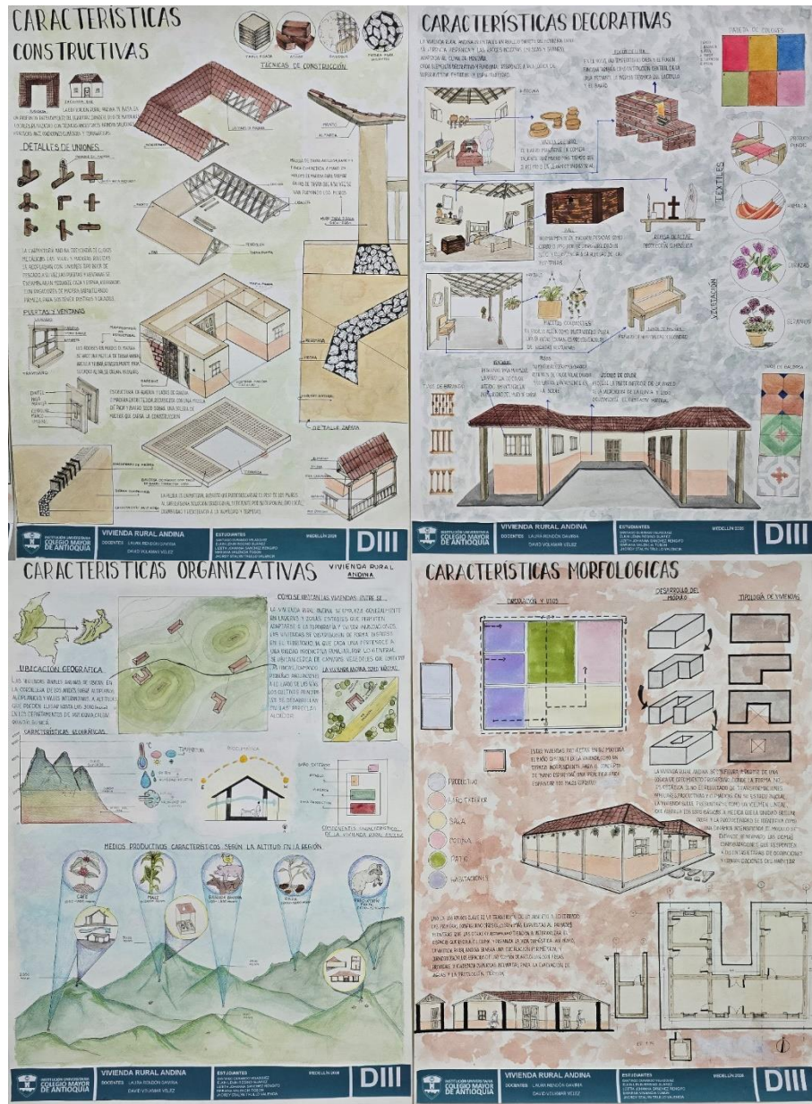
Figura 14. Fotografía estudio de caso región Andina, Grupo A.