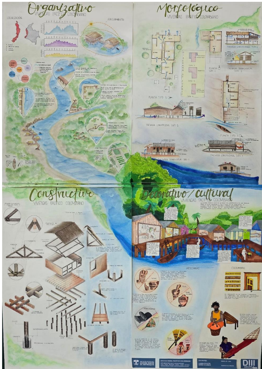
Figura 2. Fotografía estudio de caso región Pacífica, Grupo A.