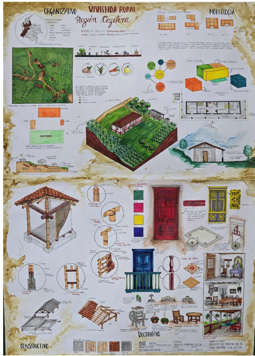
Figura 8. Fotografía estudio de caso región Cafetera, Grupo A.