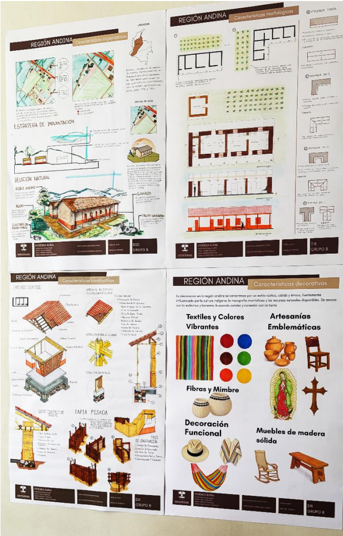
Figura 28. Fotografía estudio de caso región Andina, Grupo B.