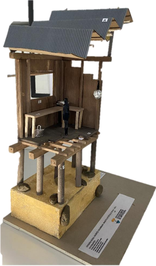
Figura 20 y 21. Fotografía estudio de caso región Pacífica, Grupo B. Imagen propia.