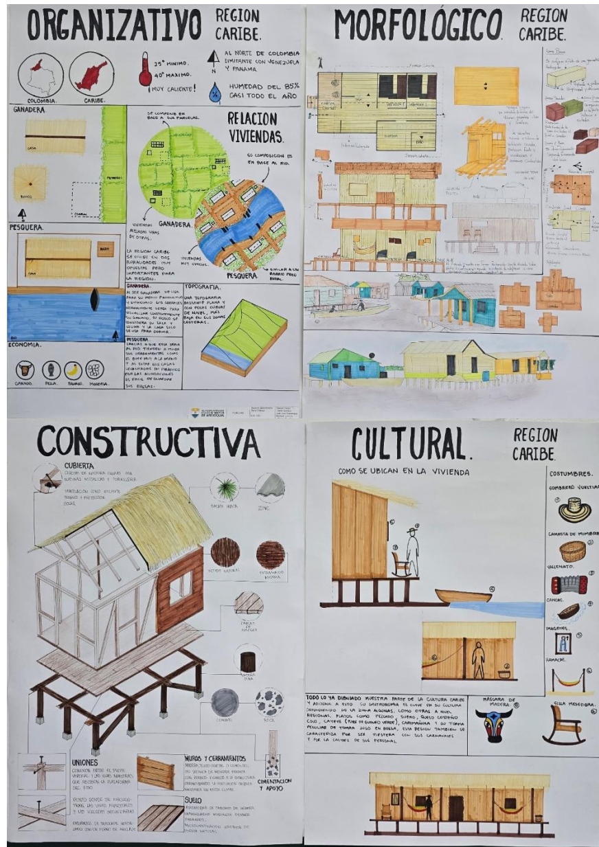
Figura 5. Fotografía estudio de caso región Caribe, Grupo A.