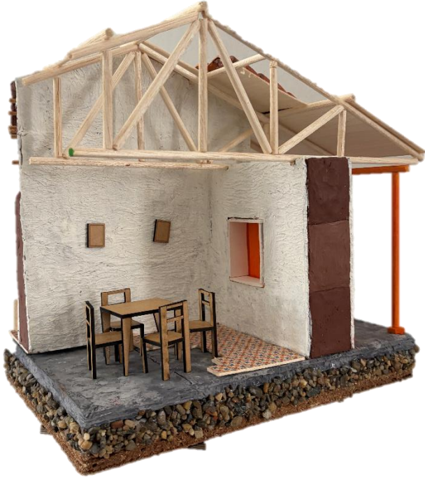
Figura 29 y 30. Fotografía estudio de caso región Andina, Grupo B.