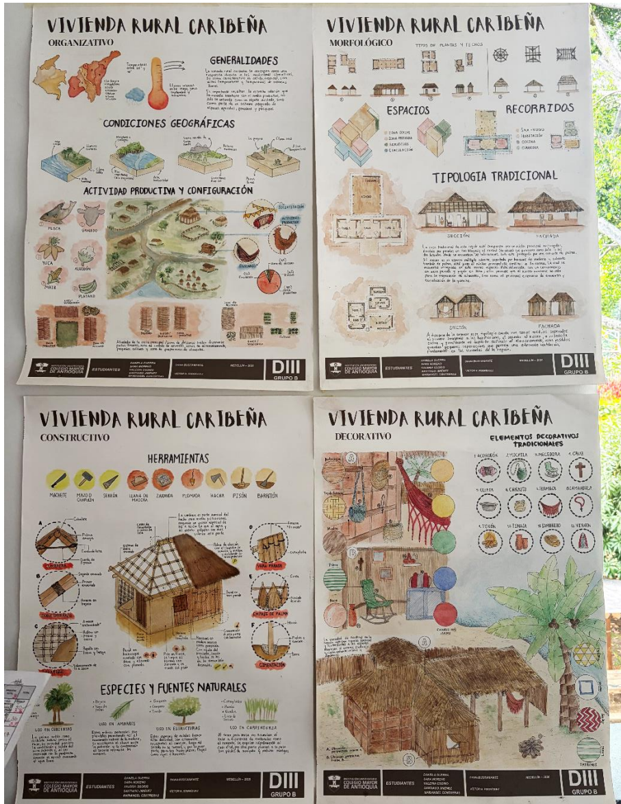
Figura 25. Fotografía estudio de caso región Caribe, Grupo B.