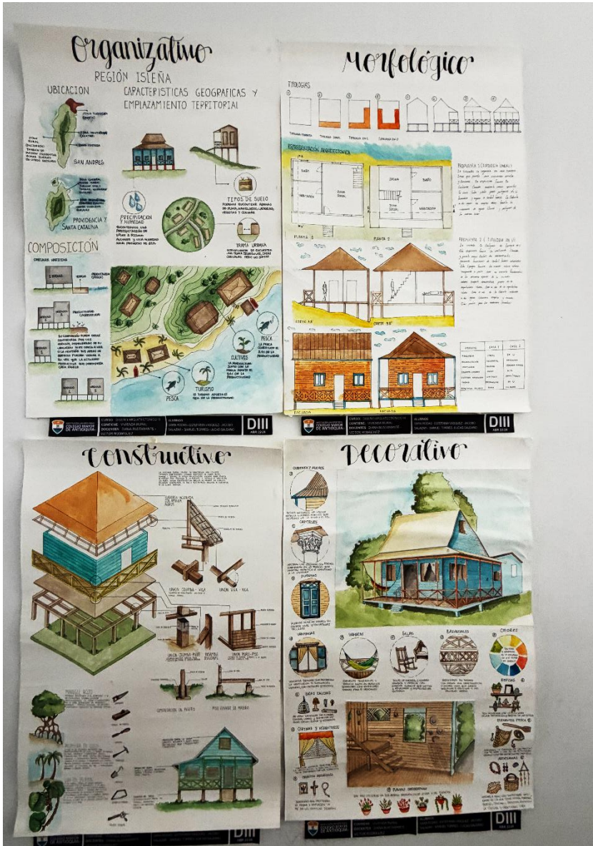
Figura 22. Fotografía estudio de caso región Isleña, Grupo B.