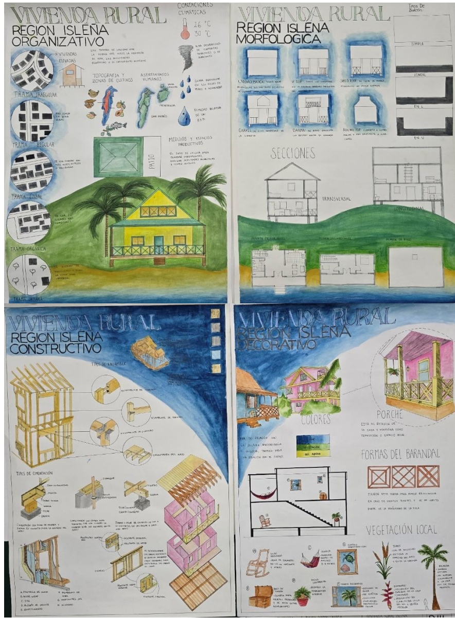
Figura 11. Fotografía estudio de caso región Islaña, Grupo A.