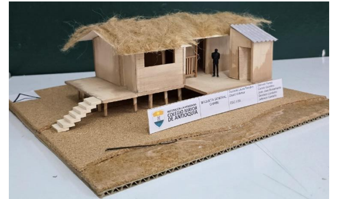
Figura 6 y 7. Fotografías estudio de caso región Caribe, Grupo A. Imágenes propias.