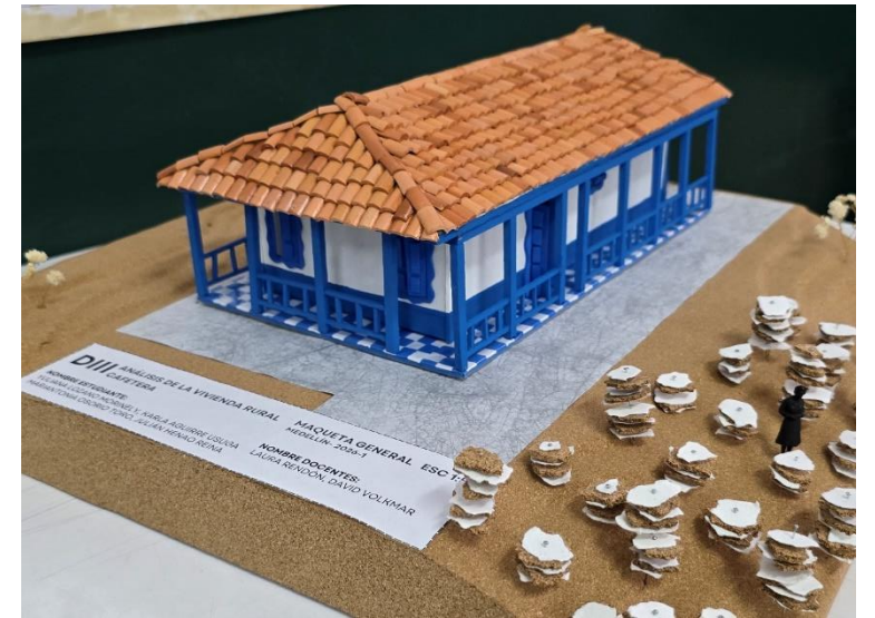
Figura 9 y 10. Fotografías estudio de caso región Cafetera, Grupo A.