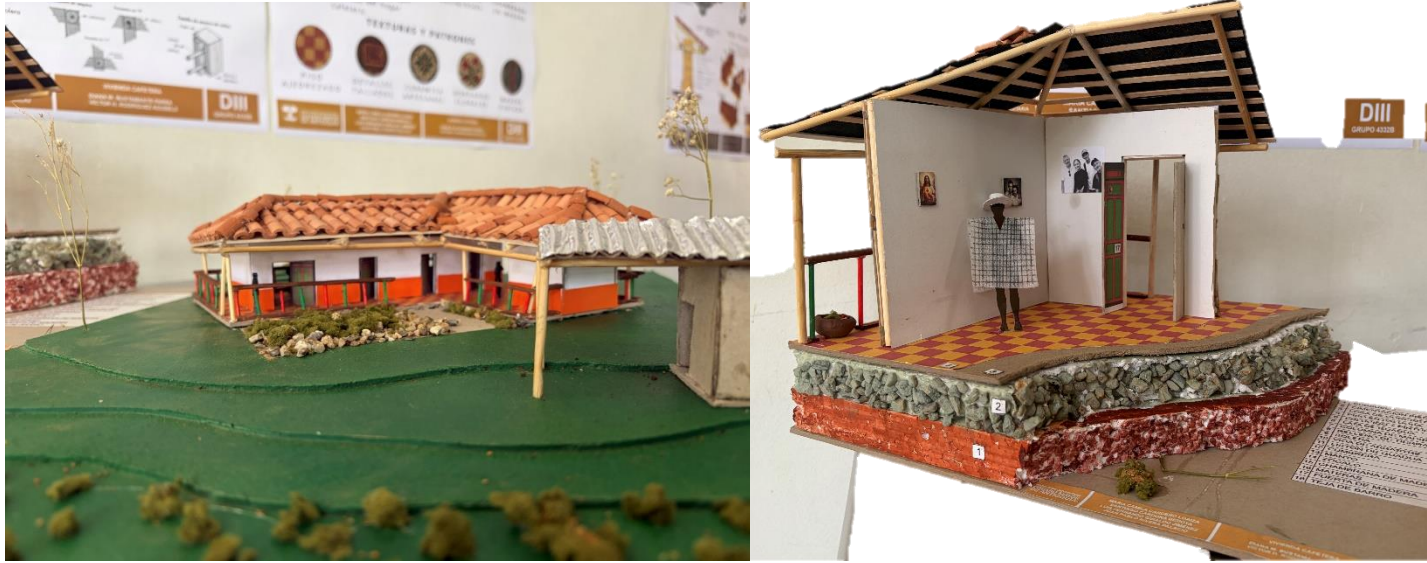
Figura 18 y 19. Fotografía estudio de caso región Cafetera, Grupo B.