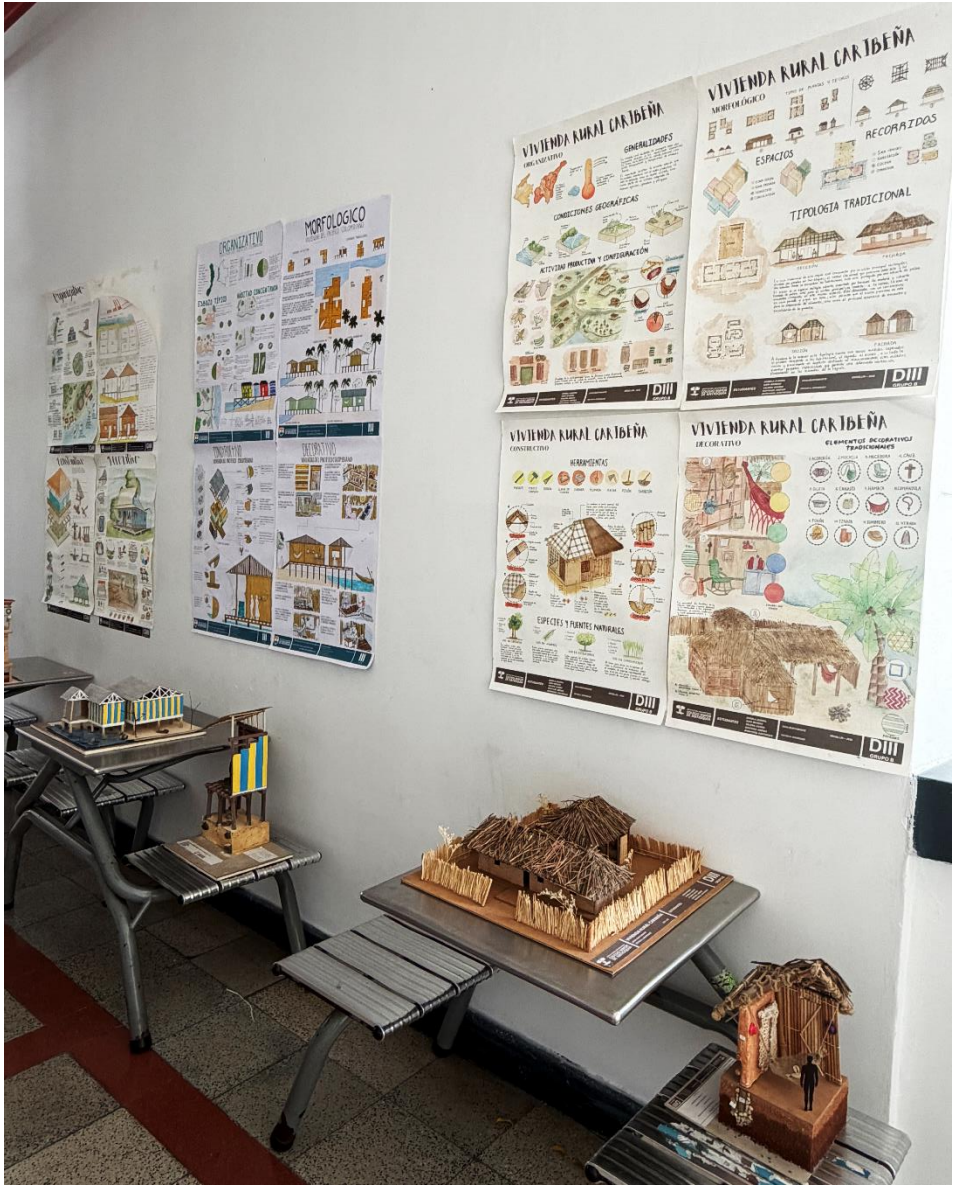
Figura 31. Fotografía muestra expositiva, Grupo B.