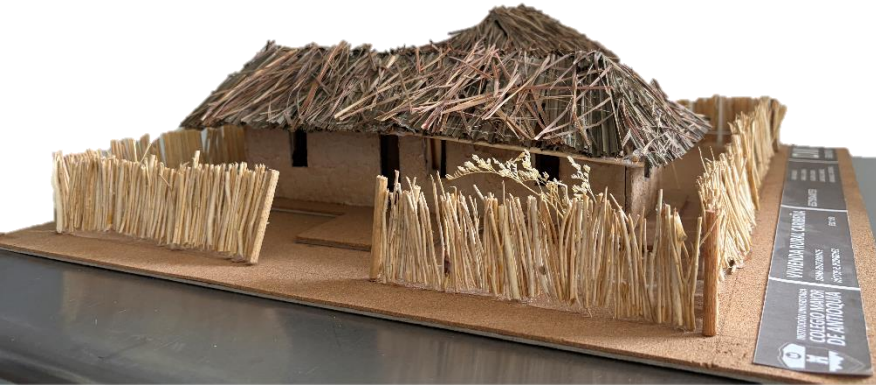
Figura 26 y 27. Fotografía estudio de caso región Caribe, Grupo B.