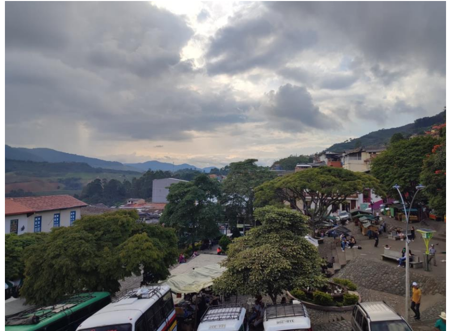
Nota: Segunda visita de campo al municipio de Concordia, Antioquia.