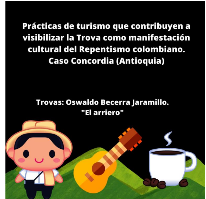
Figura 1. Trova de presentación

Nota. Trovas realizadas por Oswaldo Becerra Jaramillo. Imagen: Elaboración propia, 2022