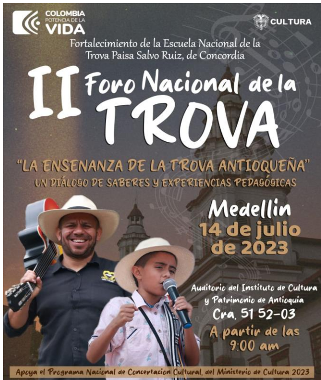
Figura 6 II Foro Nacional de la Trova