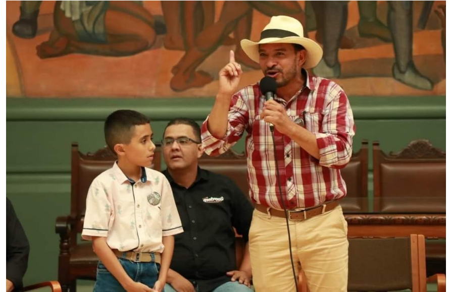
Figura 10. II Foro Nacional de la Trova

Nota. Trovador El Arriero y Gomita