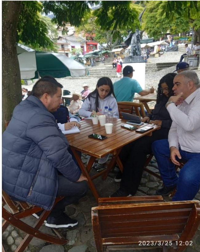
Nota. Primera visita de campo al municipio de Concordia (Antioquia)