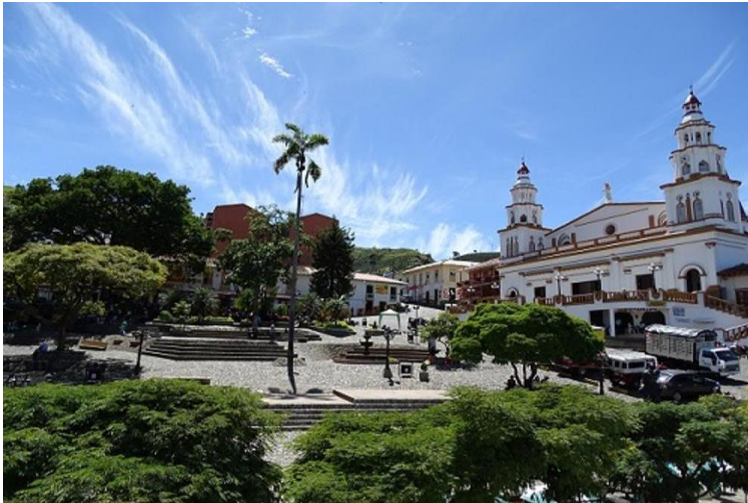
Figura 4. Parque principal de Concordia (Antioquia)

Caracterizar las prácticas de turismo cultural que contribuyen a visibilizar la Trova en el municipio de Concordia, como parte del proceso de preservación del Repentismo Antioqueño.