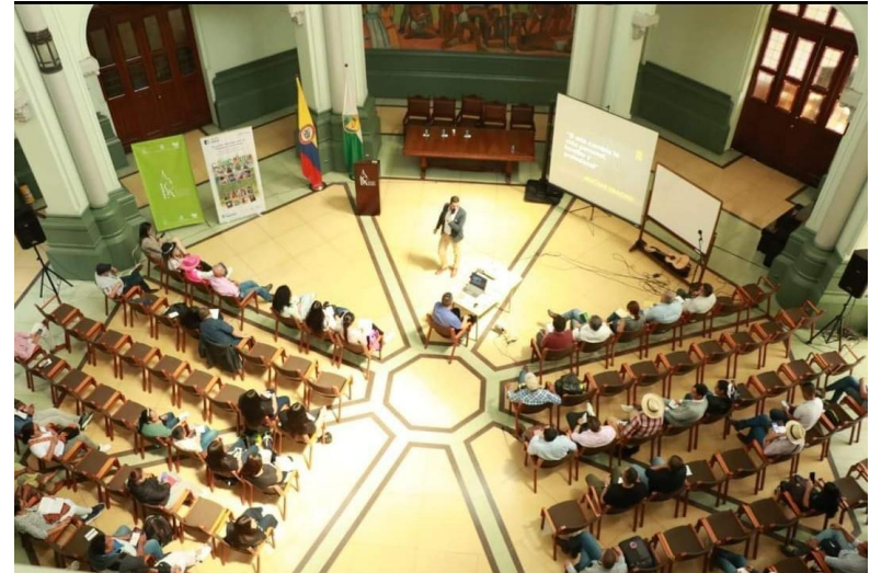
Figura 11. II Foro Nacional de la Trova .

Nota. Auditorio del instituto de Cultura y Patrimonio de Antioquia