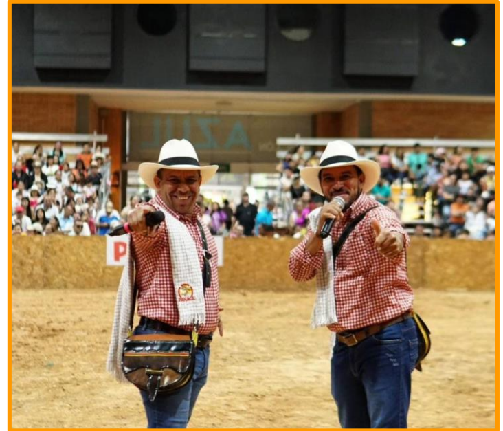
Figura 5. Trovadores de Concordia el arriero y muelitas

Nota. Presentación en Bucaramanga Fuente: Oswaldo Becerra, (12 de septiembre de 2023) "Una de mis mayores virtudes"