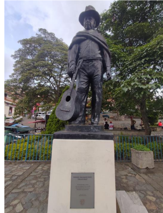
Figura 3. Escultura Salvo Ruiz

Nota. Primera visita de campo al municipio de Concordia