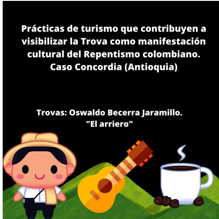
Figura 11. Trova del arriero

Nota. Trovas realizadas por Oswaldo Becerra Jaramillo.