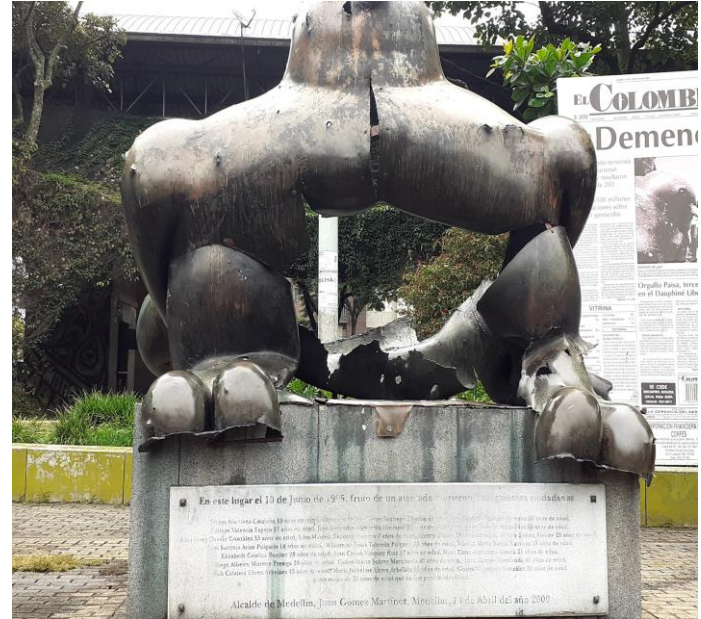
Fotografía 01. Parque San Antonio.