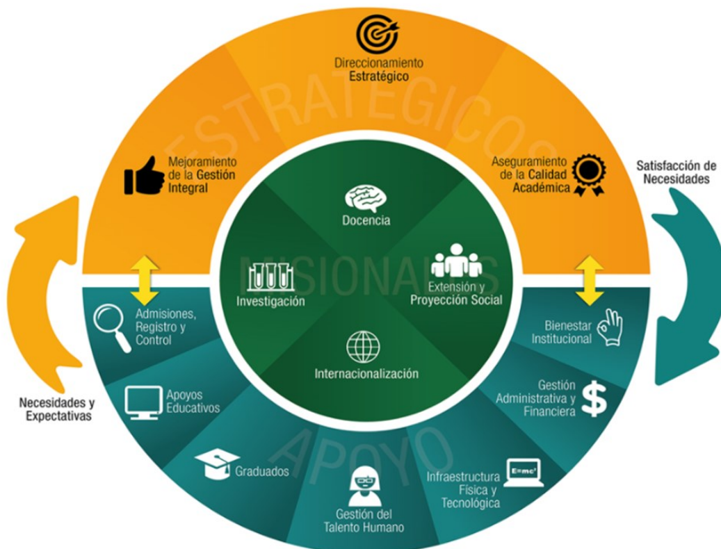
Ilustración 3. Mapa de Procesos Institucional 10

La Institución Universitaria Colegio Mayor de Antioquia, cuenta con tres macro procesos en su Sistema de Gestión Integrado (SGI): los Estratégicos (amarillos), los Misionales (verdes) y los de Apoyo (azules). El área de Gestión Documental hace parte del proceso de apoyo “Gestión Administrativa y Financiera”; sin embargo, es un proceso transversal en la estructura organizacional, como lo evidencian los diferentes procesos, procedimientos y actividades que hacen parte del sistema.