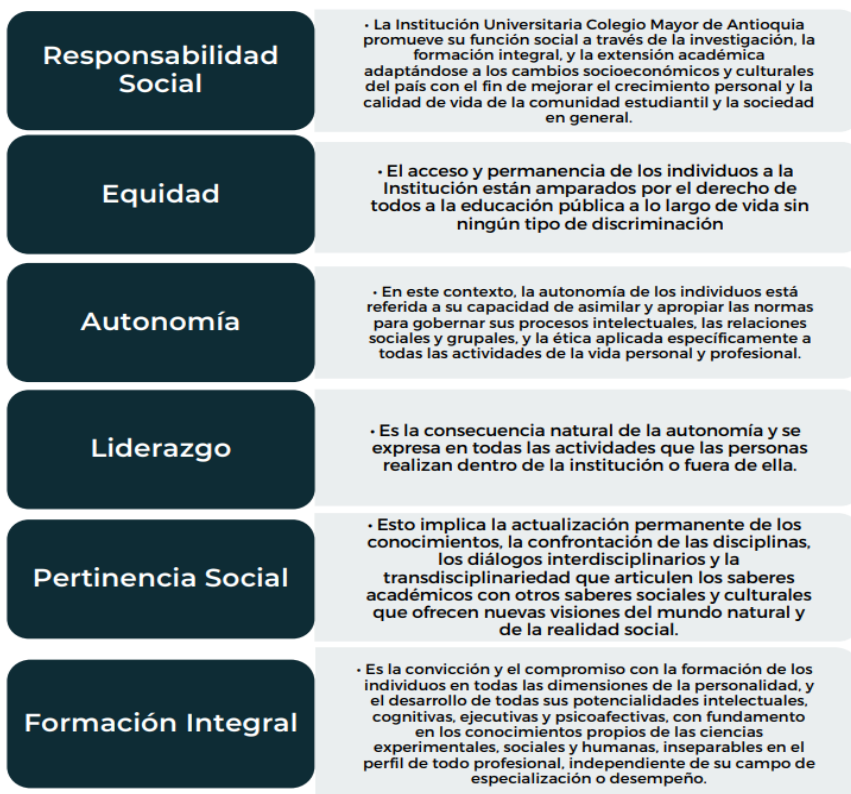
Ilustración 1. Principios Institucionales. 8

La Institución Universitaria Colegio Mayor de Antioquia adopta como principios los contenidos en el capítulo I, del Título primero de la Ley 30 de 1992 y en especial los siguientes: