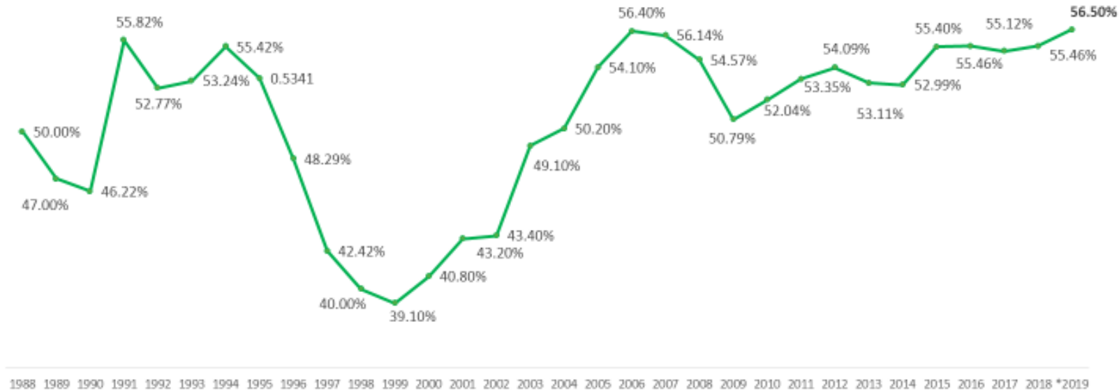
Ocupación hotelera 1988 - 2019

Durante el 2019 la ocupación hotelera continuó en la senda de crecimiento, recuperando el nivel del año 2006, con lo que se ubicó en la ocupación más alta desde que COTELCO realiza mediciones.