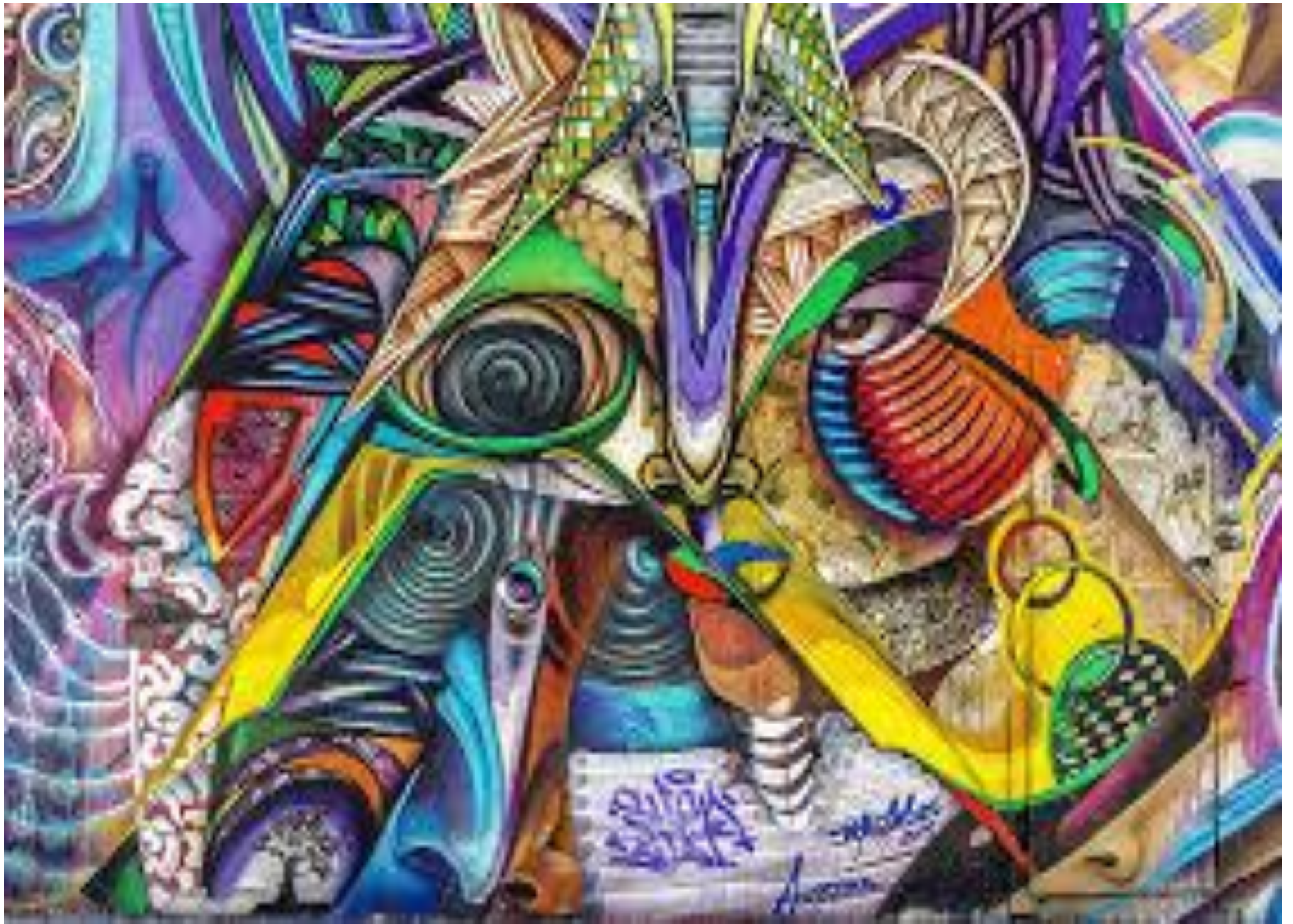
Comuna 13 Medellín