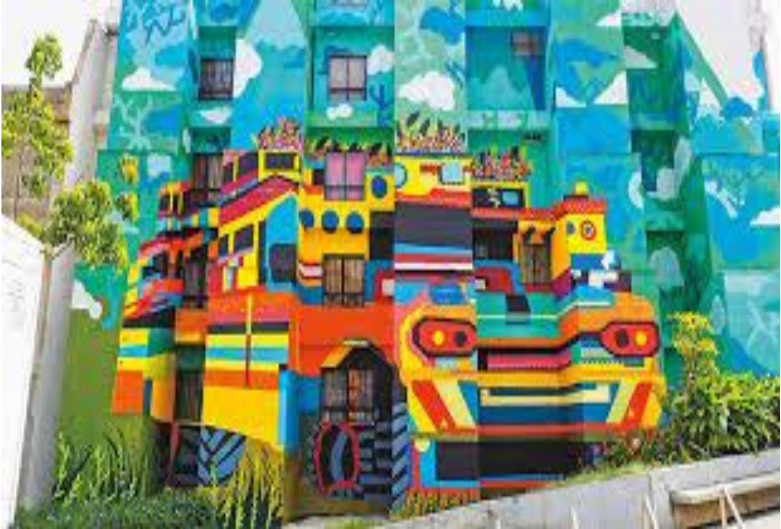
Comuna 13 Medellín