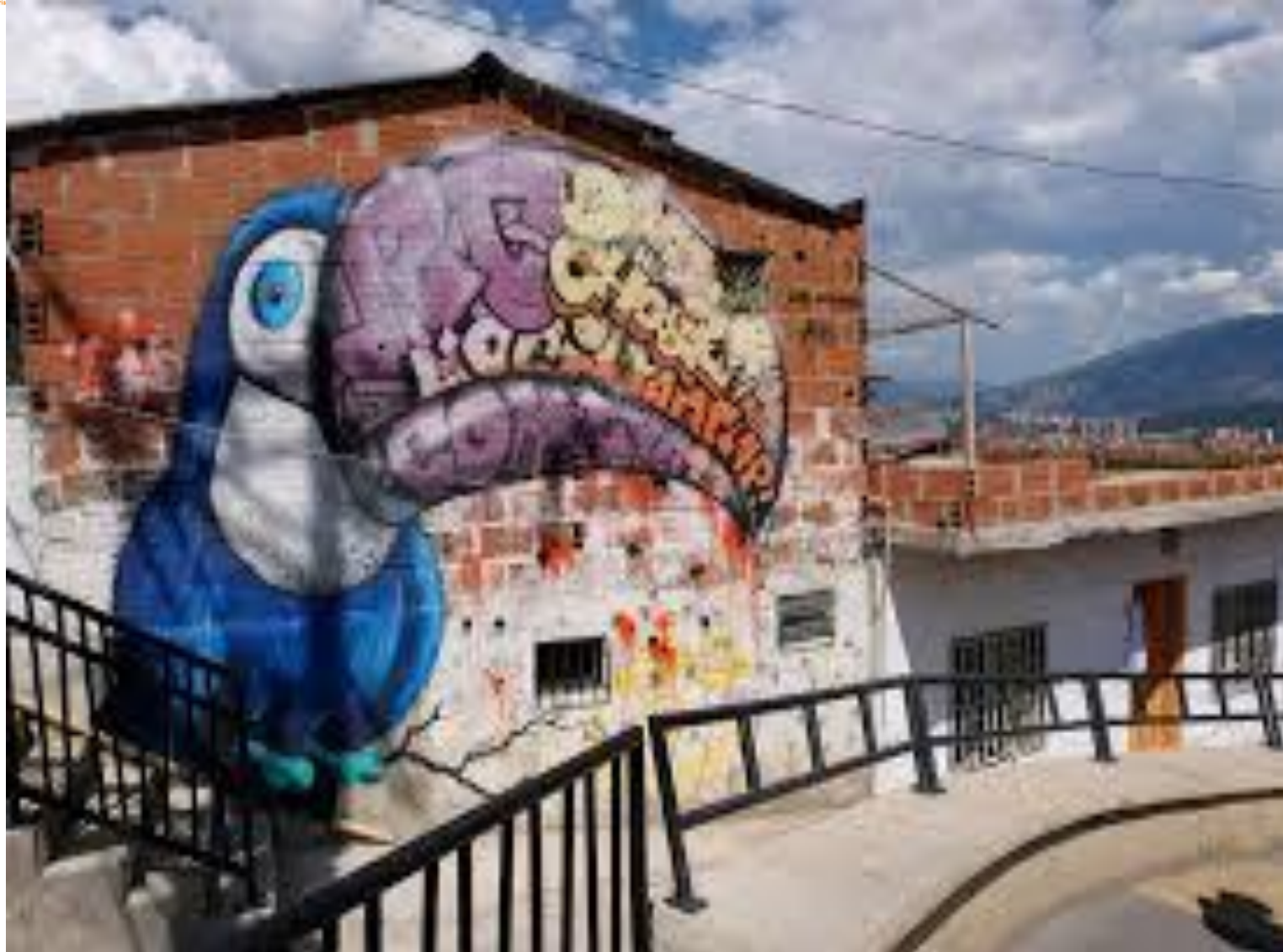
Comuna 13 Medellín