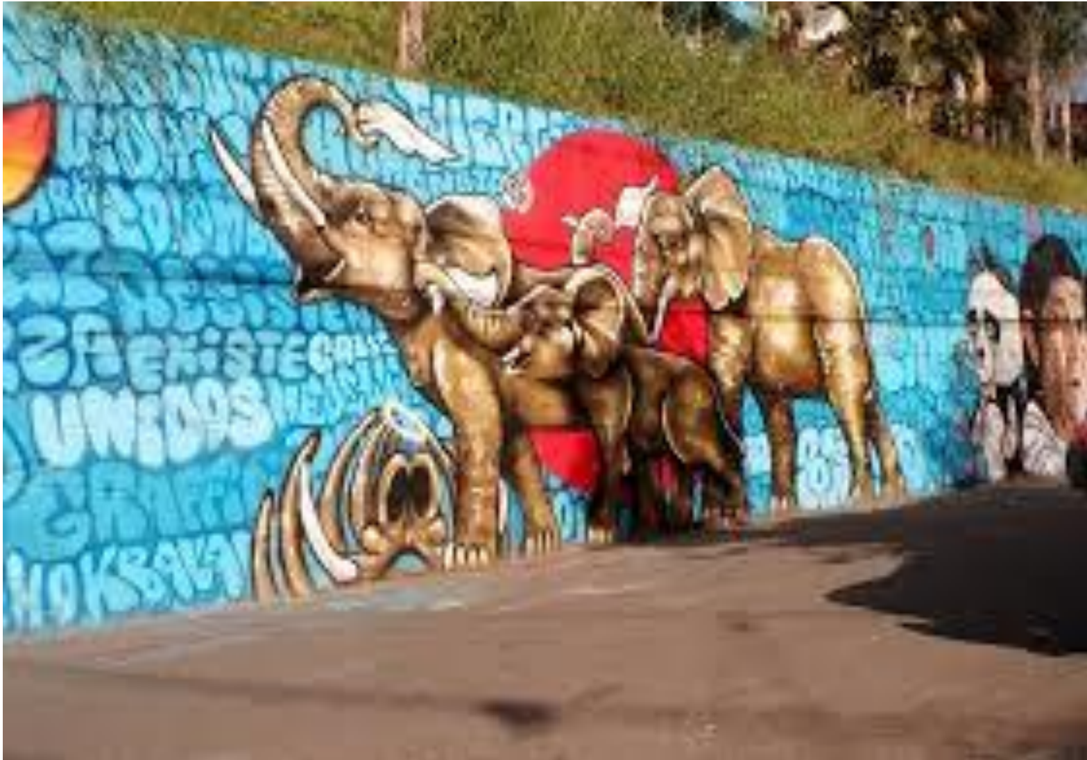
Comuna 13 Medellín