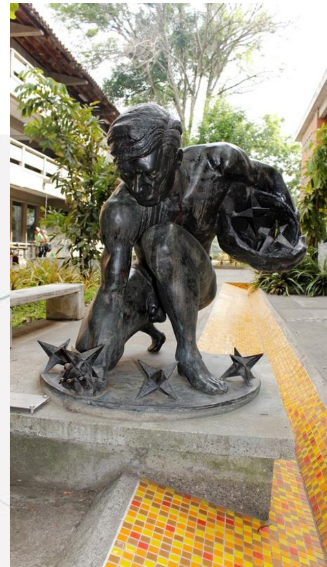
Fotografía 4: Jhony Pérez, 2016