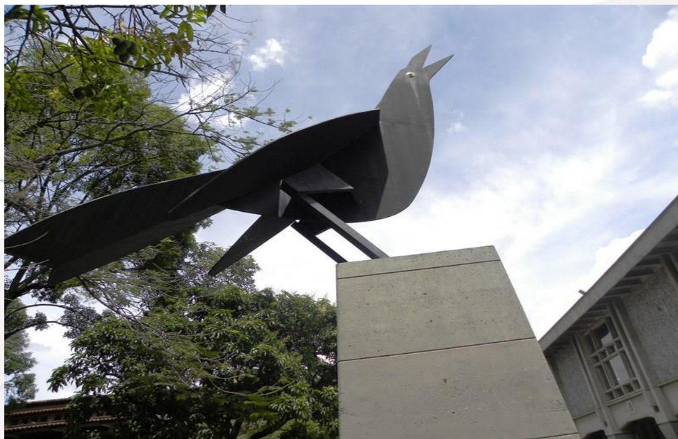
Fotografía 8: Myriam L. Cardona, 2016