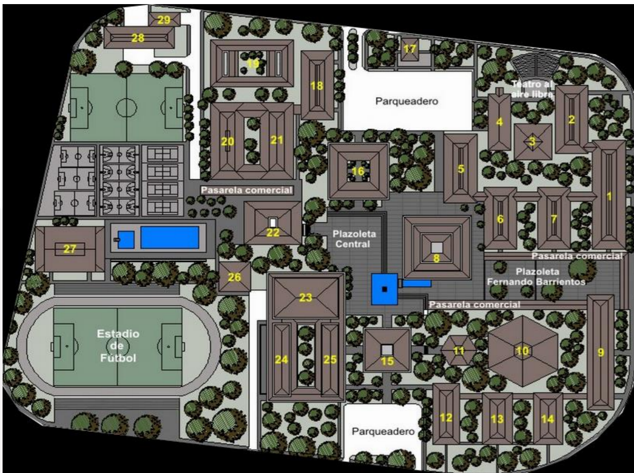
20 octubre 2014

Maneja conceptos Arquitectónicos como simetría, doble alturas, horizontalidad y pureza de líneas propias de una Arquitectura Moderna. Presenta un estado de conservación óptimo (su uso institucional demanda un constante mantenimiento y determina al mismo tiempo ciertas variaciones en los permisos para nuevas construcciones).